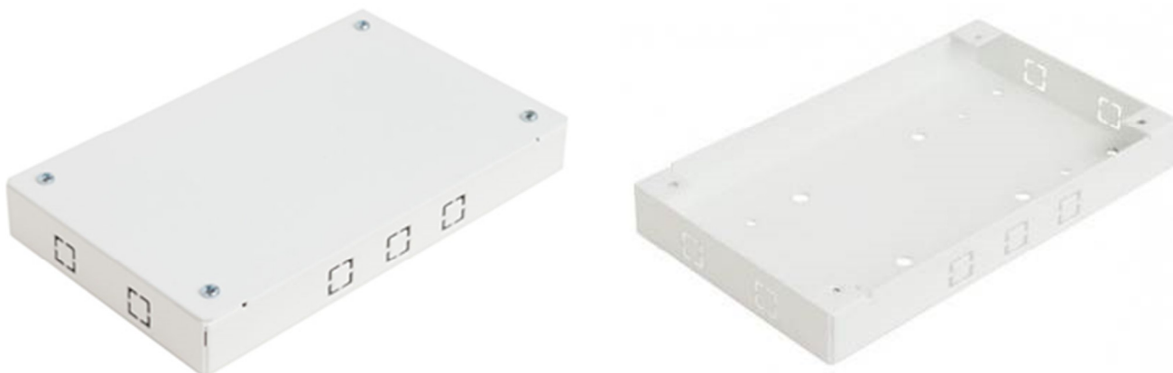
Рисунок 1 - Общий вид коммутационной коробки КК-2756

1.2 Общий вид коммутационной коробки, показан на рисунке 1.